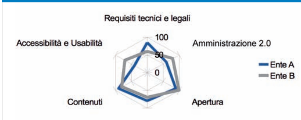
Fig. 1 - Rappresentazione radiale degli indicatori di qualità

La semplicità di rappresentazione degli indicatori in grafici radiali di immediata lettura e di immediato confronto facilita il processo di benchmarking (Fig. 1).